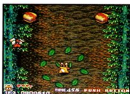
Rocky: Same as Pocky, but his power attack will cover the whole screen and will have less power than Pocky's

Spin Attack —Pocky can do a spin attack by holding the B button. This provides defense against any type of weapon. Rocky, on the other hand, will become an invincible stone statue for about 5 seconds.