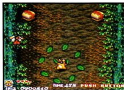
Rocky: Lo mismo que Pocky, pero su ataque cubrirá toda la pantalla y tendrá menos potencia que el de Pocky

Spin Attack (Ataque Girante) - Al oprimir el botón B Pocky puede hacer un ataque girante. Esto provea defensa contra cualquier tipo de arma. Rocky, al contrario, se convertirá en estatua de piedra invencible por unos 5 segundos.