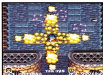
Ataque de bombas mutidireccional de Pocky

Bombs (Bombas) - Básicamente son lo mismo para ambos jugadores, sin embargo las bombas de Pocky pueden derrogar a enemigos grandes, mientras las bombas de Rocky sólo pueden derrogar a enemigos pequeños, pero tienen más alcance.