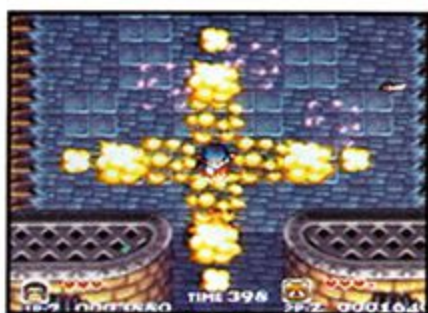
Pocky's Multidirectional Bomb attack

Bombs —They are basically the same for both players, but Pocky's bombs can defeat big enemies, while Rocky's bombs can only defeat small enemies, but covers a wider range.