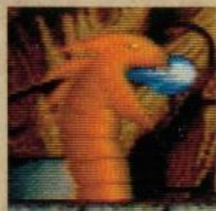
ウェーブ・ベルノ

近づいて ちかづいて 剣 けん をふるスケルトン。墓場 はかば にふさわしい魔界 まがい の住人 じゆうじん だ！