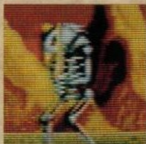
スカルウォーリア

地下 ちか に巣 す くう巨大 きゆうだい な蟻 あり 。近付 ちかづ いて噛みついてくる。