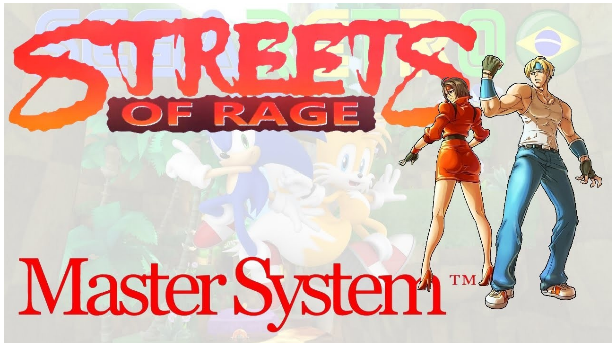
Plate forme : Master system

Parution : Megadrive, Mega cd, Master system, Game gear