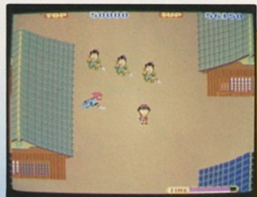
④町のどこかに忍者が潜んでいる