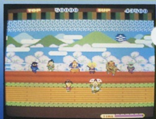
⑧"忍者プリンセス"オールスター