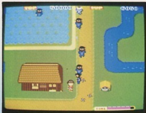
②田んぼの中では動きが鈍くなる