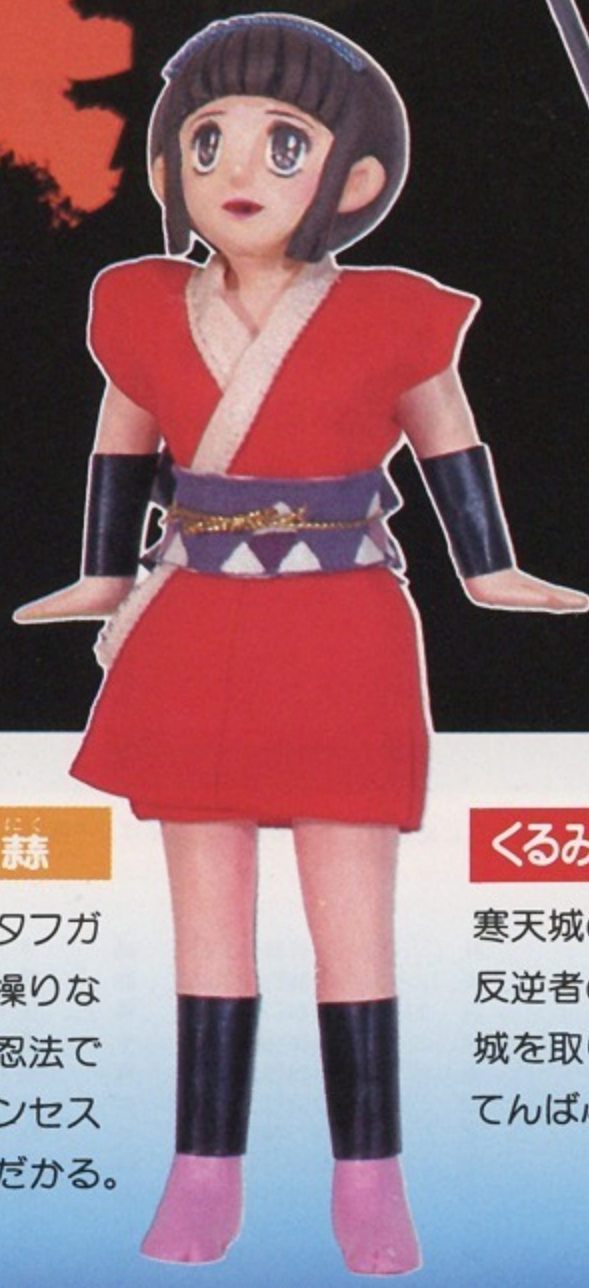
くるみプリンセス

人並はずれたタフガイ。忍者群を操りながら、豪快な忍法ではむかうプリンセスの前に立ちはだかる。