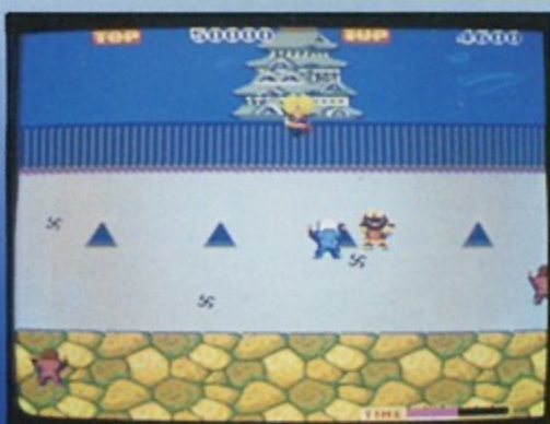
⑥石垣を越え城内に侵入