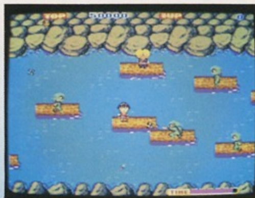
③木から木へタイミングよく移動