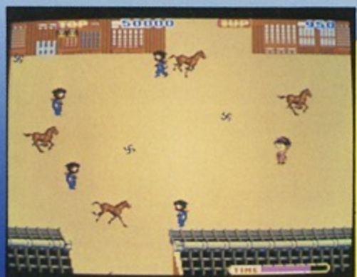
⑤暴走する馬に気をつけろ!!