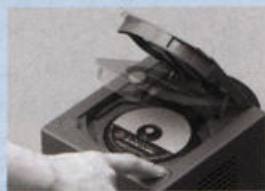
ディスクを取り出すときは、中央のディスクリリースボタンを押してください。