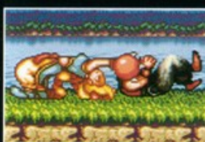
方術 ジャーマンスープレックス [つかんだ状態で十字キーの 上+Yボタン同時押し]