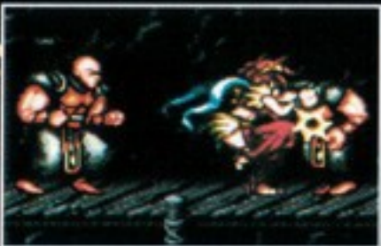
ひざ蹴り [つかんだ状態でYボタン]