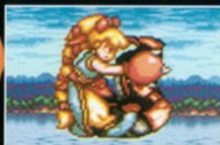
ジャンピングパワーボム [ジャンプ中、 敵に密着してYボタン]