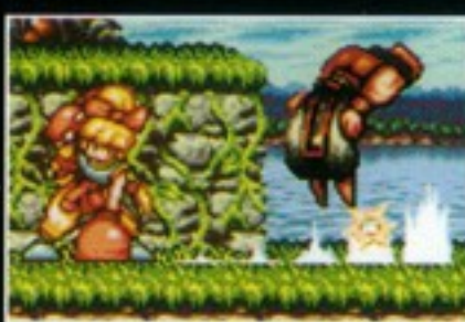
コマンド技 烈竜破弾:れつりゅうはだん [十字キーの下→上→Yボタン]