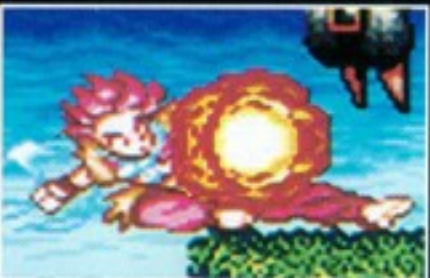
方術[Xボタン] 流風の方術は、火炎の爆発で敵にダメージを与えるものです。レベルが高くなるほど威力も増します。