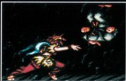
投げ [つかんだ状態で十字キーの右または左+Yボタン同時押し]