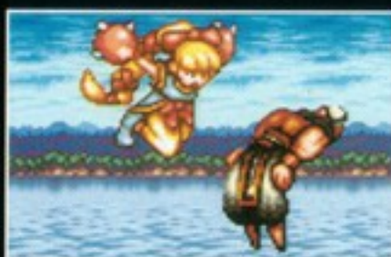
ひざ落とし [ジャンプ中、十字キーの 下+Yボタン同時押し]