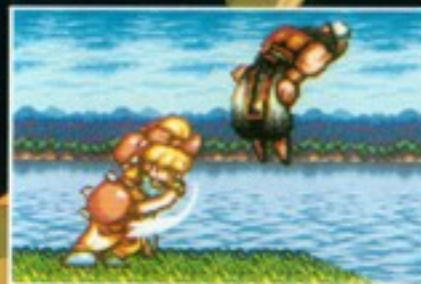
特殊技 ダッシュストレート [Yボタンを押し、全身が明るく 光りだしたら離す]