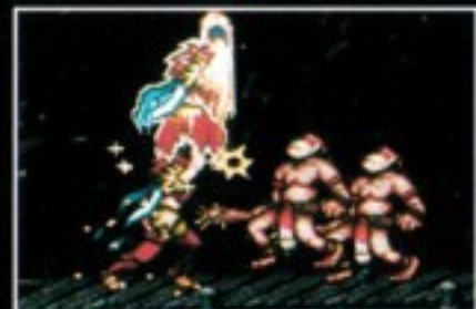
必殺技 泡影拳:ほうえいけん [Y+Bボタン同時押し]