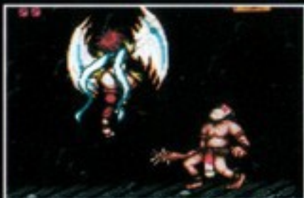
コマンド技 飛翔拳:ひしょうけん [十字キーの下・上・Yボタン]