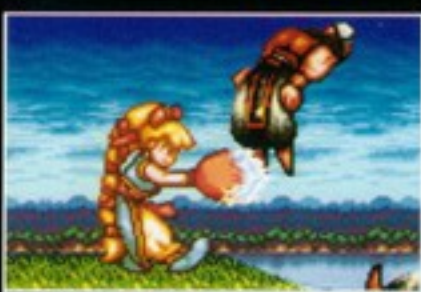
必殺技 爆砕双拳:ばくさいそうけん [Y+Bボタン同時押し]