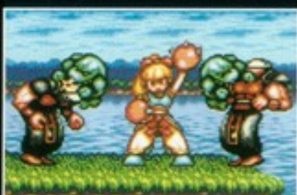
方術 [Xボタン] 波無寿の方術は、気のかで 様々な支援キャラクターを 召喚するものです。