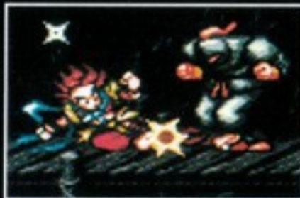
特殊技 スライディングキック [十字キーの斜め下+Yボタン同時押し]